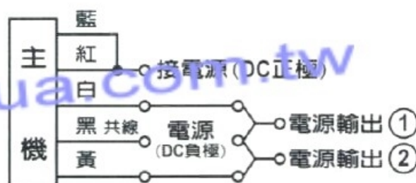
(圖二) 電源輸出配線法