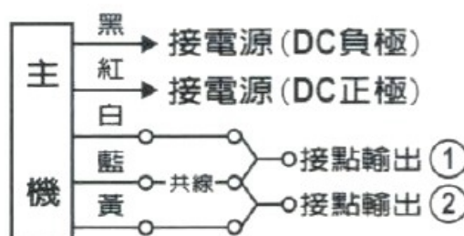
(圖三) 接點輸出配線法